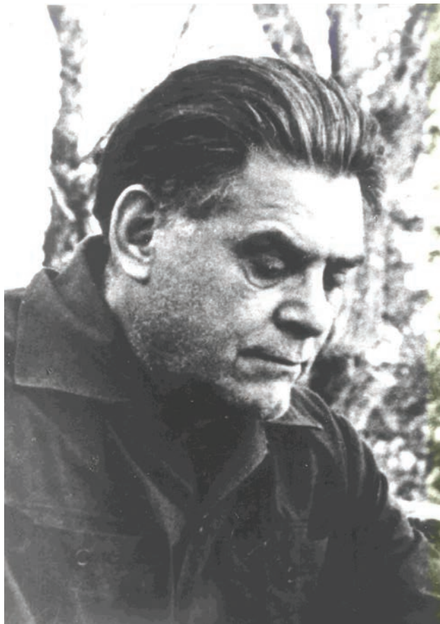
Vladan Desnica (pred kraj života) Osobna ostavština Vladana Desnice